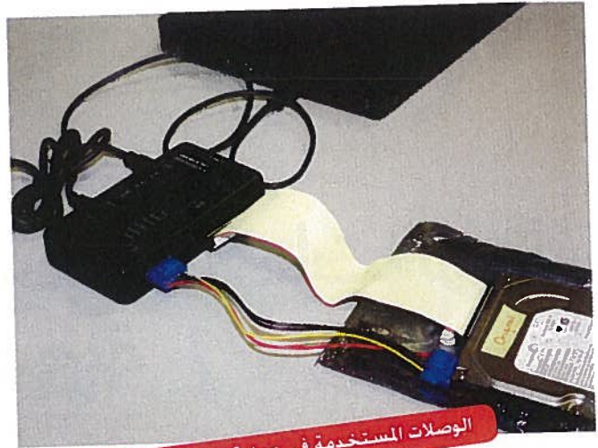
الوصلات المستخدمة في عملية نسخ القرص الصلب

وأخيراً، نود أن نقدم كلمة شكر للدكتور إبراهيم بقيلي على توجيهه لنا وإرشاده الدائم لإجراح المشروع، ونشكر كلية تقنية المعلومات على ترشيحها لمشروعنا في قائمة أفضل مشروع على مستوى الكلية وعلى تشجيعهم لنا كذلك، ولا ننسى إدارة الجامعة التي قدرت مجهودنا وكرمتنا، ونحب أن نشكر كل من ساعدنا في إجراح هذا المشروع من مدرسين وطالبات.