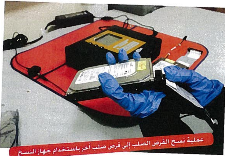
عملية نسخ القرص الصلب إلى قرص صلب آخر باستخدام جهاز النسخ